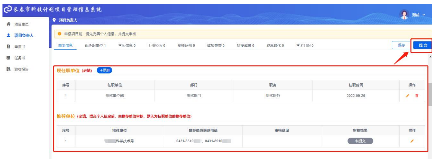
图 2-6 项目负责人-现任职单位与推荐单位

2.4 项目负责人信息提交后，等待推荐单位审核结果，审核通过则可使用个人账号其他功能。未审核通过前不可使用其他功能，如项目负责人信息被退回，需根据修改意见重新完善项目负责人信息并再次提交。