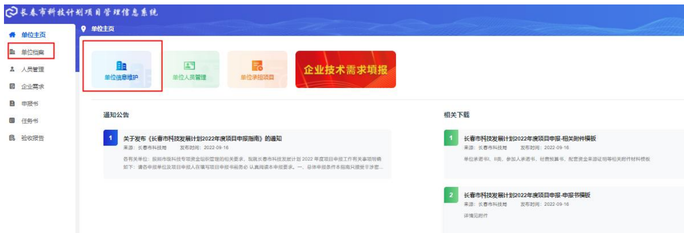
图 1-4 单位主页

1.2 进入单位主页，可查看通知公告与相关下载，也可使用快捷入口。点击左侧导航“单位档案”或者快捷入口“单位信息维护”跳转到单位档案页面。