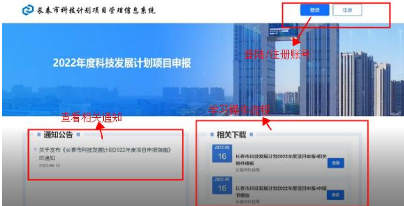
图 2-1 平台首页