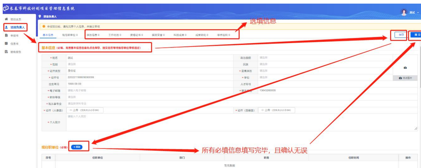
图 2-5 项目负责人-基本信息

所在单位的选项，需要您单位负责人再注册一个 单位账号 ，完善单位信息并提交，审核通过后，再登陆个人账号选择现任职单位)，必填信息全部填写完毕且确认无误后点击右上角“提交”按钮进行提交。