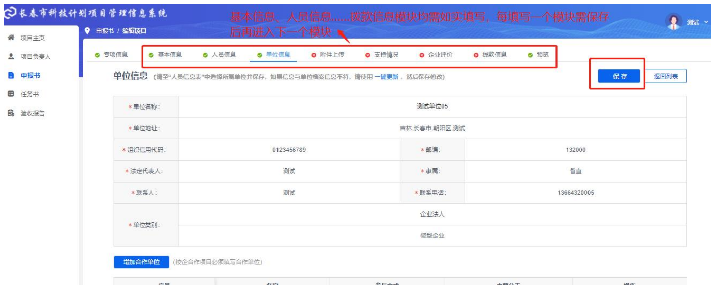
图 3-3 编辑项目