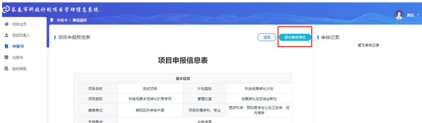
图 3-4 提交推荐单位

3.5 项目申报书被推荐单位推荐，以及市科技局业务处室审核通过后，再下载打印申报书及其他附件材料，加盖单位公章后，对纸质材料进行送审。具体送审地点、送审材料份数等需按照申报指南或通知的相关要求进行。