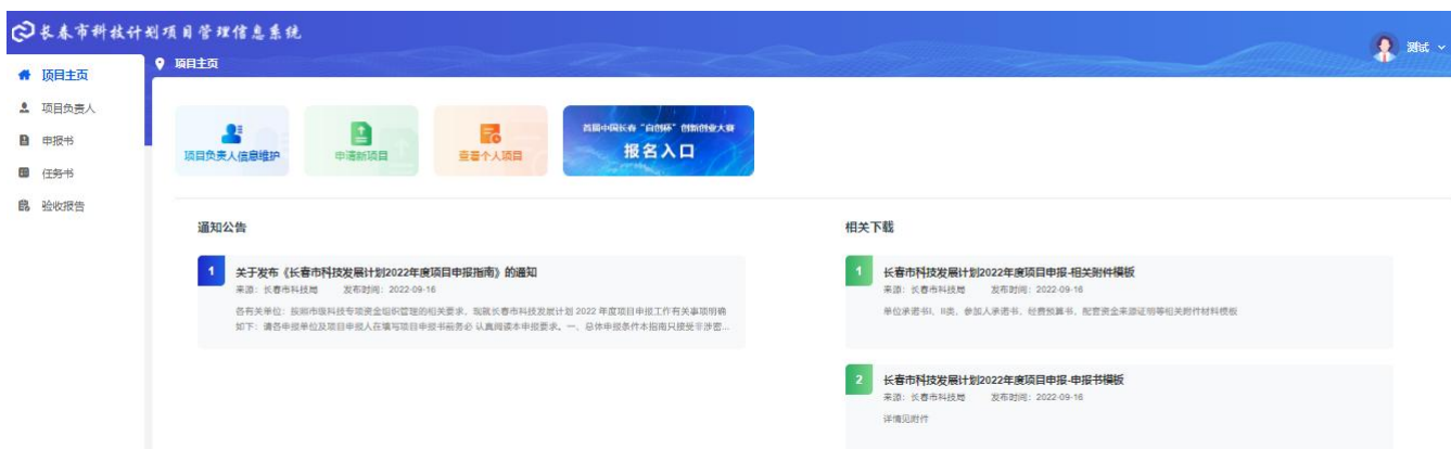
图 2-4 项目主页

2.2 进入项目主页后，可查看通知公告与相关下载，并使用快捷入口功能。点击左侧导航“项目负责人”或者快捷入口“项目负责人信息维护”进入项目负责人信息页面。