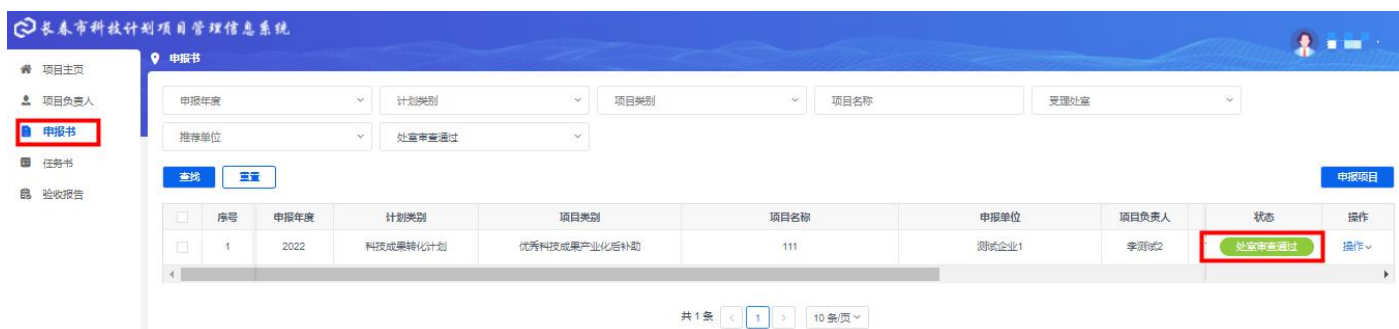
图 3-5 申报书-处室审查通过

3.5 项目申报书被推荐单位推荐，以及市科技局业务处室审核通过后，再下载打印申报书及其他附件材料，加盖单位公章后，对纸质材料进行送审。具体送审地点、送审材料份数等需按照申报指南或通知的相关要求进行。