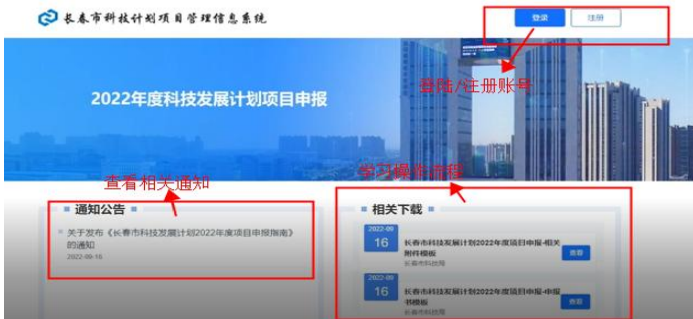
图 1-1 平台首页

1.1 注册账号。点击右上角“注册”按钮，选择身份“单位注册”，填写注册信息，完成注册。