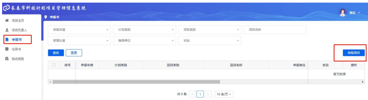
图 3-1 申报书

3.1 个人账号审核通过后，登陆个人账号，点击左侧导航“申报书”，进入该页面，点击右上角“申报项目”按钮。