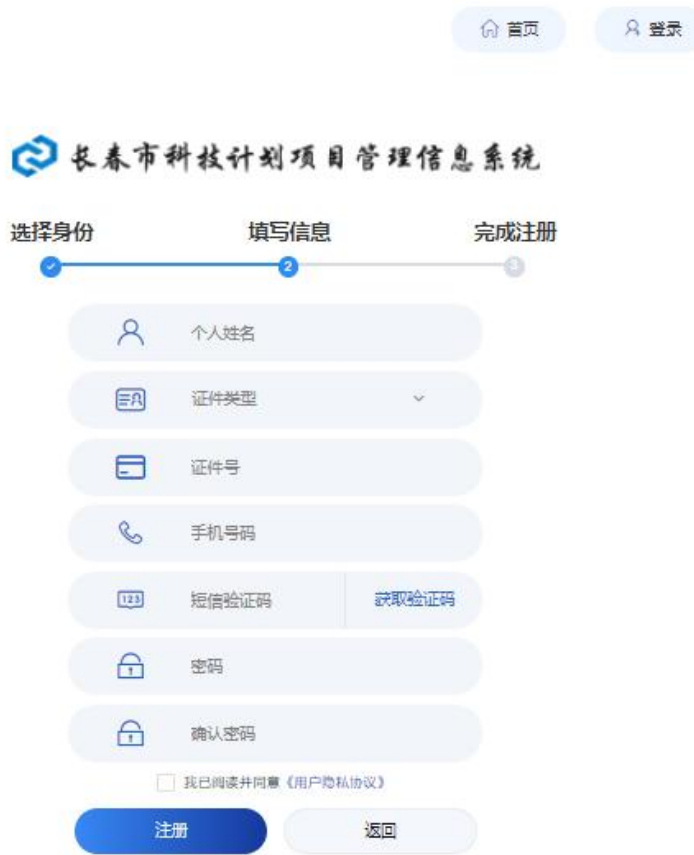
图 2-3 注册信息

2.2 进入项目主页后，可查看通知公告与相关下载，并使用快捷入口功能。点击左侧导航“项目负责人”或者快捷入口“项目负责人信息维护”进入项目负责人信息页面。