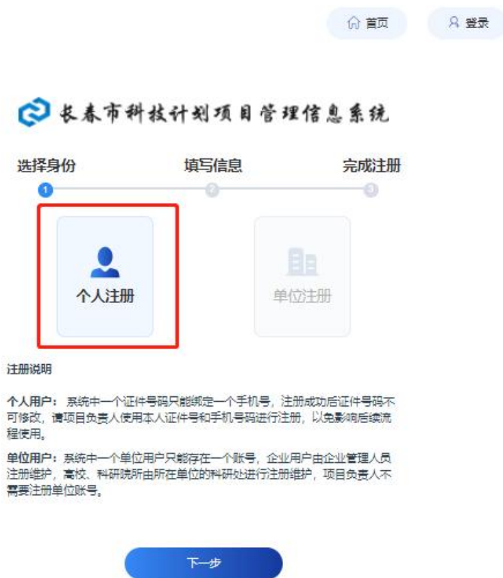
图 2-2 选择身份